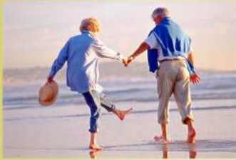
سلامتی و عمر